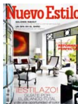
Nuevo Estilo: 2,50€

En cuanto a Clinisord, empresa especializada en complementos auditivos ( www.clinisord.com ), los portadores de la Tarjeta de Usuario del Grupo HM tienen un descuento del 30 por ciento en los audífonos que adquieran en sus locales.