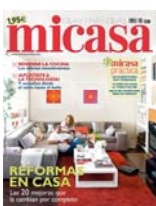
Mi casa: 1,95€