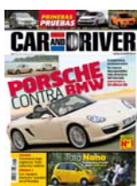
Car & Driver: 2,80€