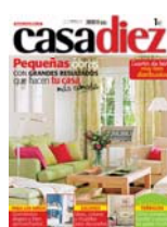
Casa Diez: 1€