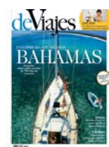
De Viajes: 2,70€